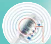
Piezo Chip Υπερήχων Αποκλειστικά με την EMMI-DENT.